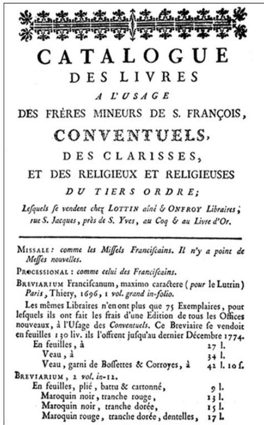
Planche 2a : Catalogue des livres à l'usage des Frères mineurs de s. François dans Offices notés à l'usage des Frères mineurs de S. François , Paris, Augustin-Martin Lottin, 1773, p. [3].

C'est un phénomène bien connu que toute réforme religieuse s'accompagne à plus ou moins brève échéance d'une réforme de la liturgie en vue d'une unification des pratiques. Les trois livres pointés par les constitutions (bréviaire, cérémonial, chant) sont justement ceux à travers lesquels se forge une identité communautaire et nouvelle là où, jusqu'alors, chaque branche, parfois même chaque province, possédait sa propre tradition 12 . Dans les faits, cela se traduit souvent par une réforme systématique des livres liturgiques. Le Catalogue des livres à l'usage des Frères mineurs de s. François, Conventuels, des clarisses, et des religieux et religieuses du Tiers ordre placé par Augustin-Martin Lottin à la fin des Offices notés donne une vue d'ensemble des nouveaux livres nécessaires.